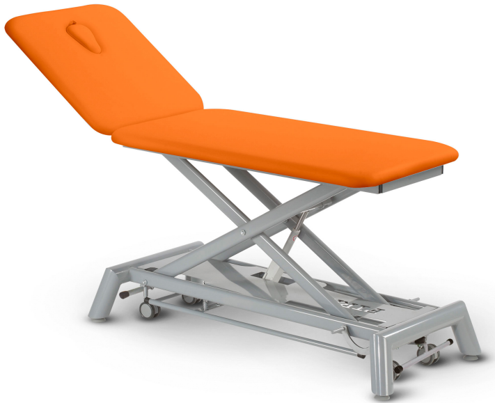
Table Axess Duo D1