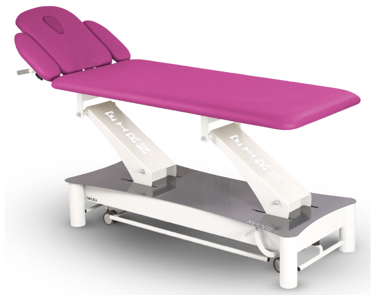
Table Modul Excel E3