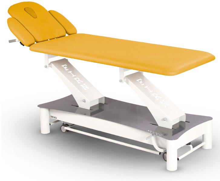
Table Modul Excel E3