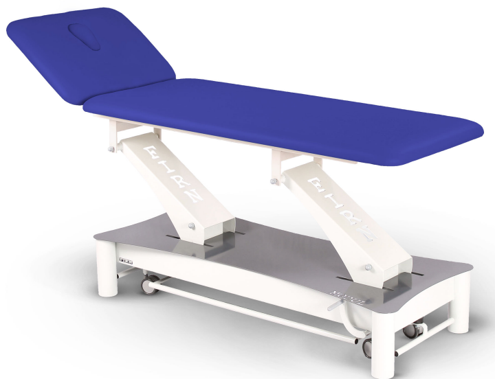
Table Modul Excel E1