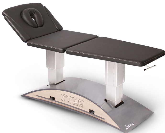
Table Luxury Trio