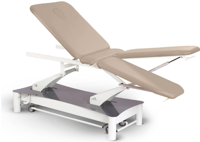
Table Modul Quatro