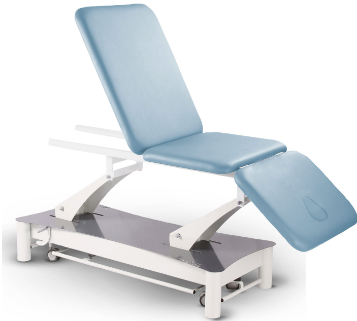
Table Modul Trio TS1