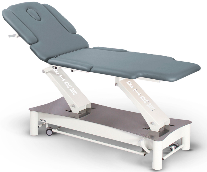
Table Modul Duo XL