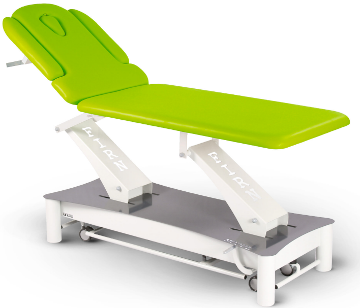
Table Modul Duo D3