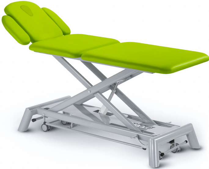
Table Axess Trio T3