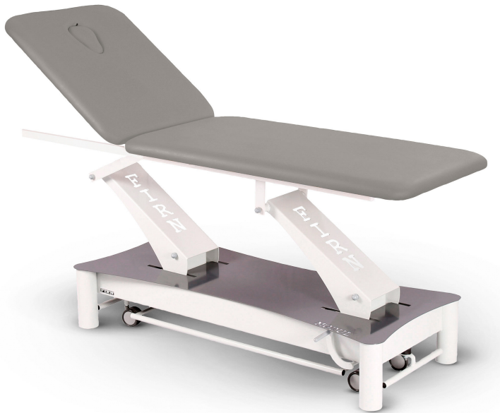
Table Modul Duo D2