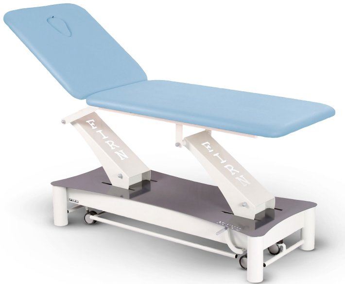
Table Modul Duo D1