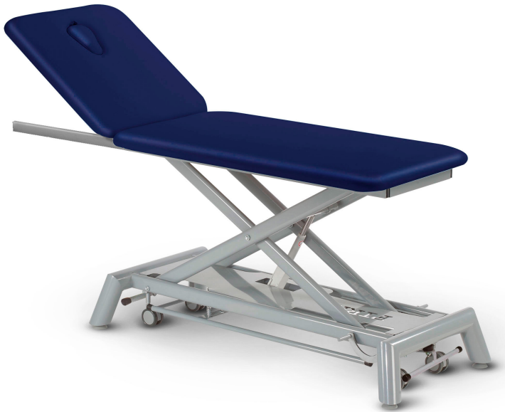
Table Axess Duo D2