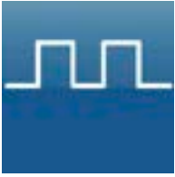
Courant pulsé à haute tension