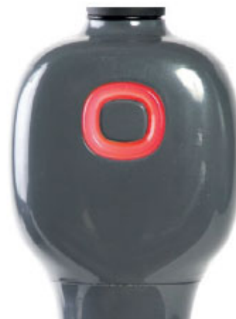
Vitesse trop lente