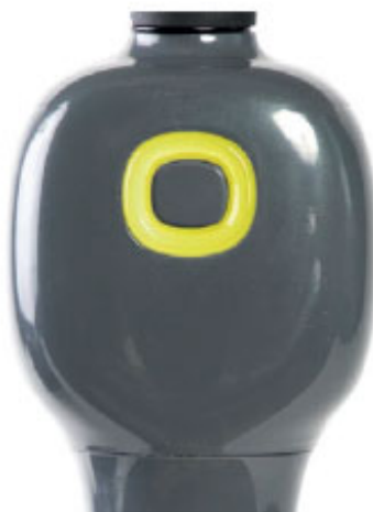
Vitesse trop rapide