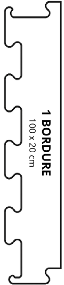
1 BORDURE 100 x 20 cm