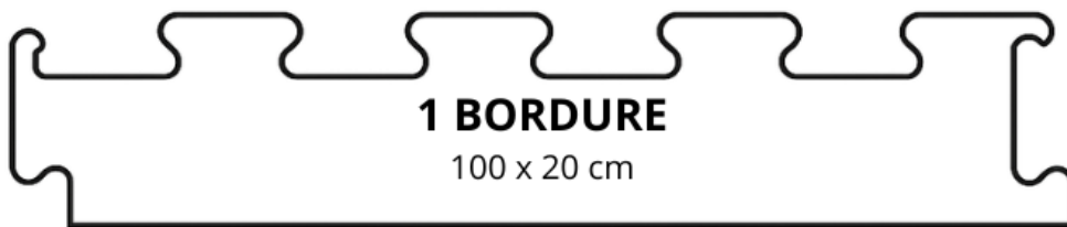
1 BORDURE 100 x 20 cm