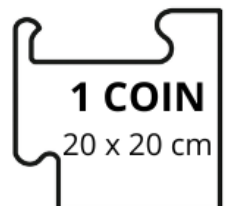
1 COIN 20 x 20 cm